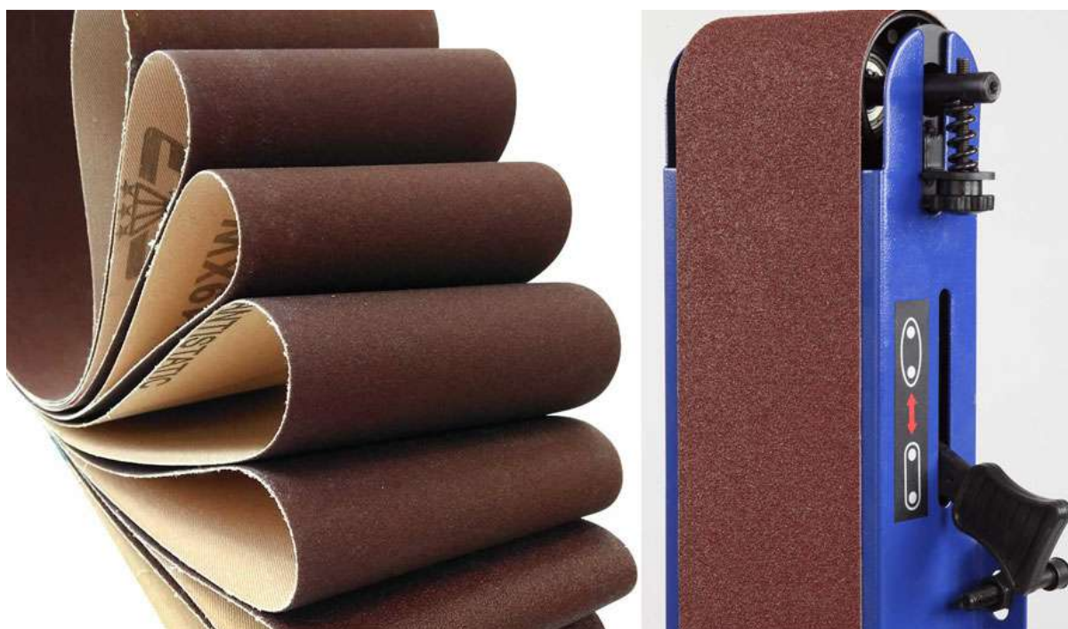
Таблица 2. Ассортимент бесконечных шлифовальных лент

Поставляются пять размеров бесконечных лент – 25×769, 100×610, 102×915, 152×1219 и 152×2520 мм (Ш×Д), таблица 2.