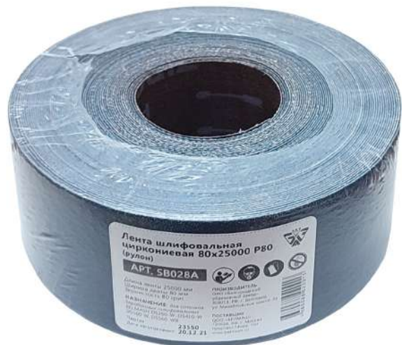
Таблица 3. Ассортимент шлифовальных лент в рулонах